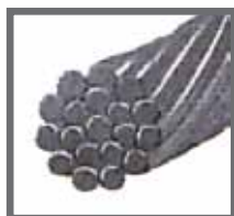
Černý pletený hedvábný materiál