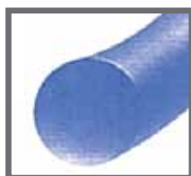
Modrý polypropylenový monofilní materiál