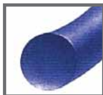
Černý nebo modrý PVDF monofilní materiál