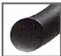
Černý polyamidový monofilní materiál (polyamid 6.6)