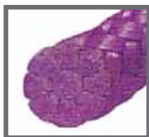
Sinusorb® střednědobě vstřebatelný pletený materiál (PGA)