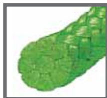
Zelený nebo bílý pletený polyesterový materiál