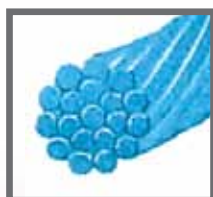
Modrý pletený panenský hedvábný materiál